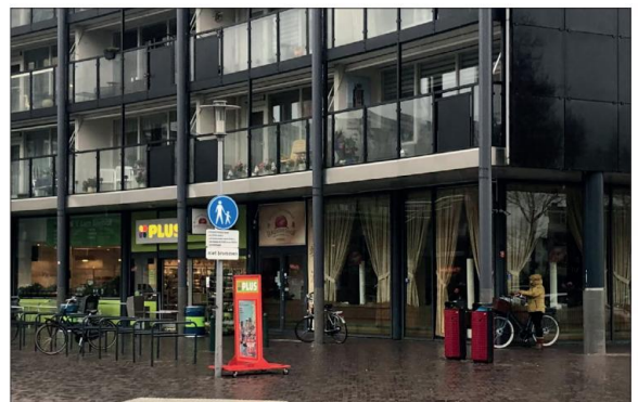
Plus 't Lam met op de hoek Chinees restaurant Brokaathof