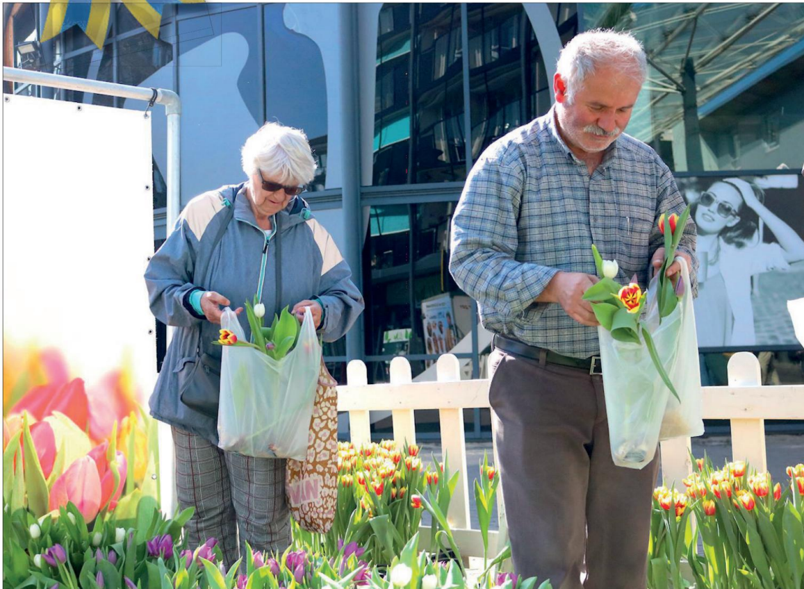
'Lente in de Bieshof'. Op zaterdag 26 maart werd in winkelcentrum Bieshof de lente gevierd. Op deze dag stond de tulp centraal. Het plein veranderde in een mooie bloementuin. Op vertoon van de kassabon mocht er een bosje tulpen worden geplukt. Dit alles onder het genot van gezellige Hollandse liedjes die ten gehore werden gebracht.

Wijkkrant voor Stadspolders en De Hoven jaargang 25 - nummer 2 - april 2022