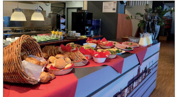
Het ontbijt in Het Polderwiel staat klaar

Aan het einde van het interview heb ik nog wel een paar vragen. In het interview ging het voorna-