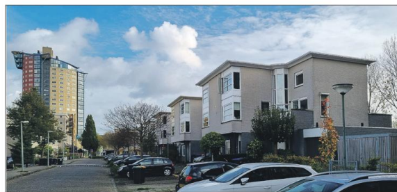
Woon-werk- en kangoeroewoningen aan de Merbau

wijk is een beperkt aantal extra ruime woningen met mogelijkheden voor bescheiden kantoor- of bedrijfsruimte ontworpen. Daar hoorde ook extra parkeer ruimte bij.