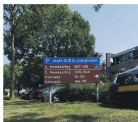
Bebording voor het parkeersysteem

Binnen enkele woonbuurten, zoals Palissander, Colorado en