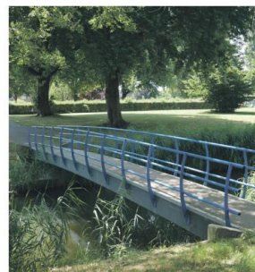
Betonnen liggers en stalen leuningen