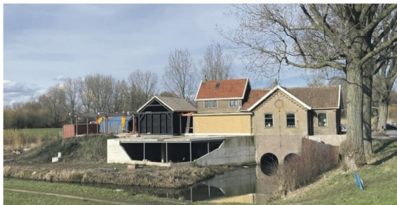
Gemaal 14 maart 2023

De plannen zijn niet veranderd en de verbouwing gaat zoals we de vergunning hebben gekregen. In het Gemaal komt de woning, waar ik zelf ga wonen. In de schuur en een nieuw te bouwen deel ernaast komt een horecagelegenheid. Alex Verburg van restaurant Post zal dit exploiteren.