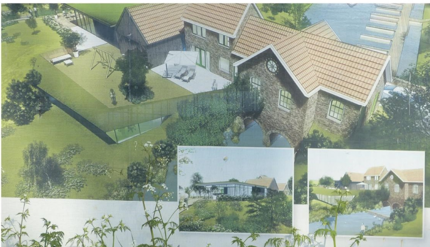
Gemaal in 2024 -->