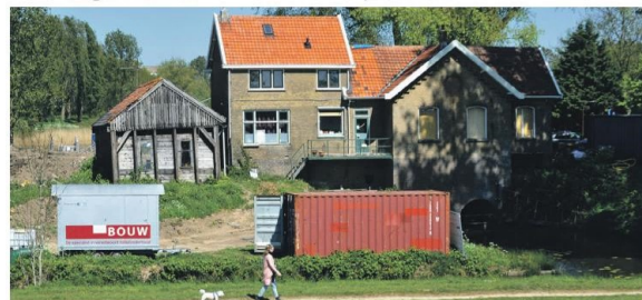
Gemaal voor 2018

Maar er kunnen ook nog onvoorziene zaken opspelen. Zo blijkt dat de huidige stroomvoorziening naar het gebied aan de Loswalweg niet voldoende is voor het restaurant, waar verder ook nog camping Het Vissertje en de Kleine Rug elektriciteit afnemen. Stedin zegt dit voor 15 oktober te gaan realiseren."